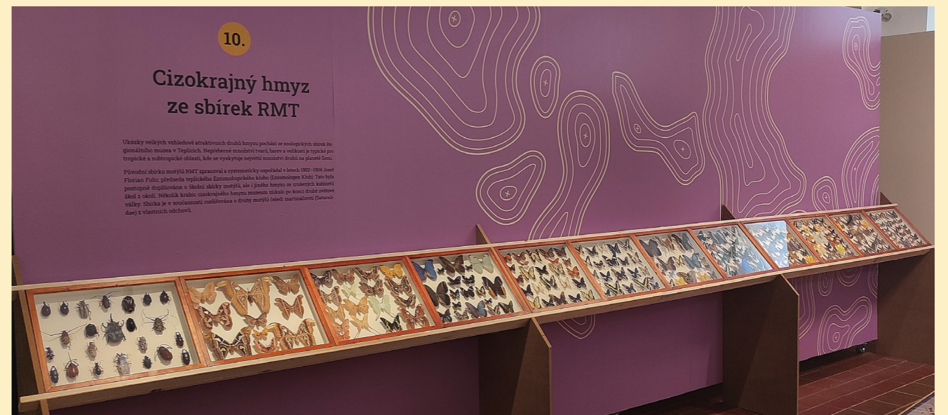
Obr. 4: Součástí výstavy byly také ukázky exotických druhů motýlů ze sbírek teplického muzea.