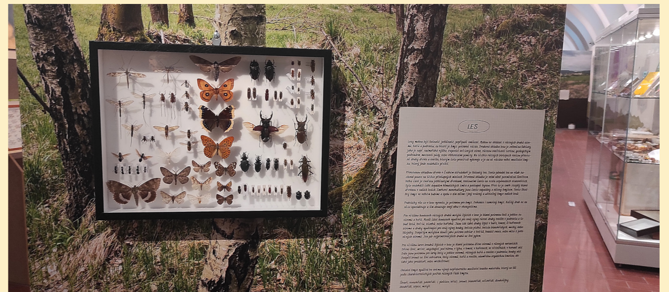
Obr. 6: Jedna ze zastávek prezentující vazbu hmyzu na přírodní stanoviště, v tomto případě na les.